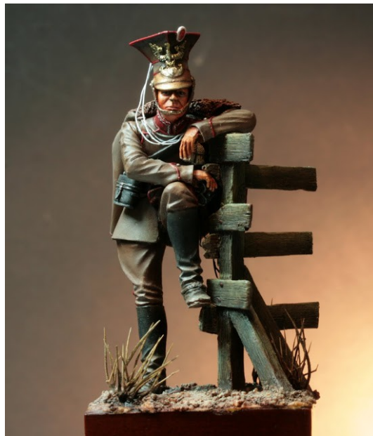
"Officier de Uhlans polonais 1916" (JMD miniatures) Peinture de Michel Schwartzweber