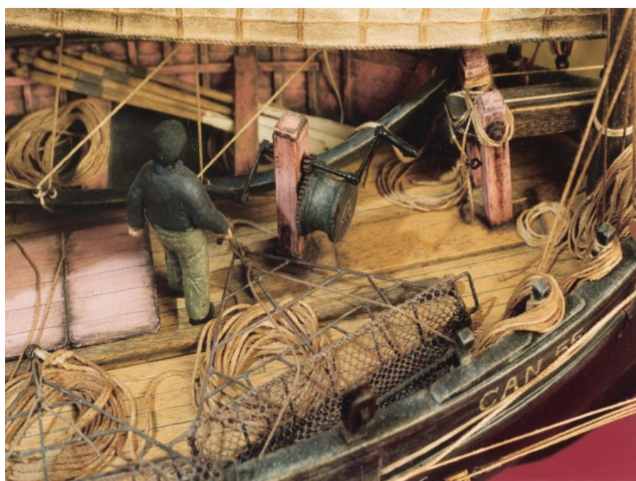
La Perle, une bisquine de Cancale avec son équipage. Il y longtemps !

C'était il y a une vingtaine d'années. D'une façon à la fois classique, par la maquette, et quelque peu insolite, puisqu'il s'agissait de maquettes en bois de vieux gréements. Je m'attachais à les rendre réalistes par la peinture (déjà !). Puis j'y ai ajouté des personnages (des figurines en plastique de la marque Starlux transformées, quel programme ...). Et les bateaux ont fini par disparaître pour laisser la place à des socles, mais toujours en bois !