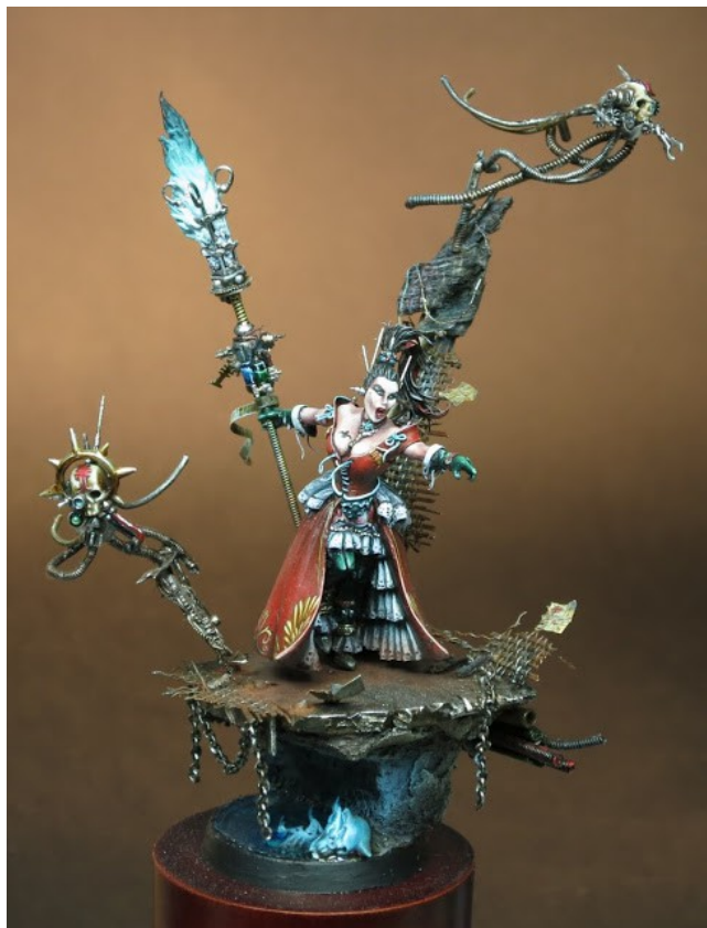
« Inquisitrice de l'Imperium » (Games-Workshop) 30 mm Transformation et peinture de Christian Hardy