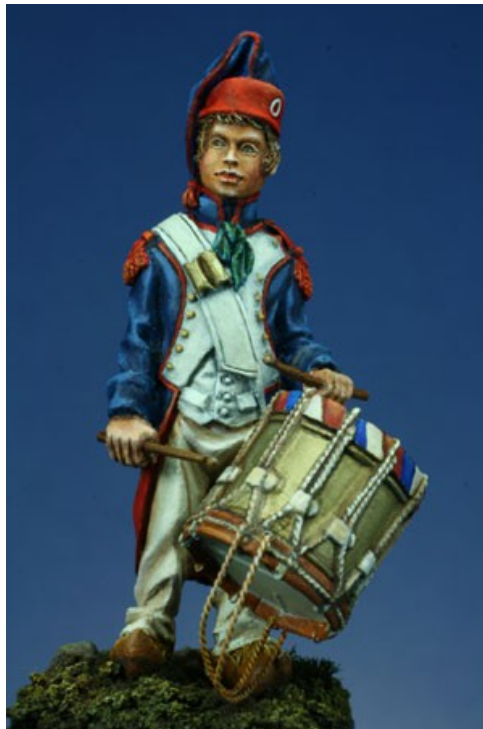
Breton du 18 ème siècle (54 mm) Sculpture : Grégory Girault

3 Figurines officielles de l'édition 2013.