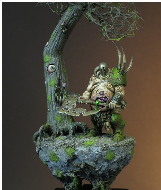
"Champion de Nurgle" (Games-Workshop) 30 mm Peinture d'Adrien Leloup

De façon à respecter les normes de sécurité en vigueur dans la salle d'exposition, nous demandons à chaque exposant de se munir d'un tissu spécifique pour la mise en valeur du linéaire alloué (tissus M1 non feu). Nous vous en remercions par avance. Nous vous encourageons à venir avec votre (petit) matériel car un espace démonstration peinture et création sera ouvert le samedi et le dimanche.