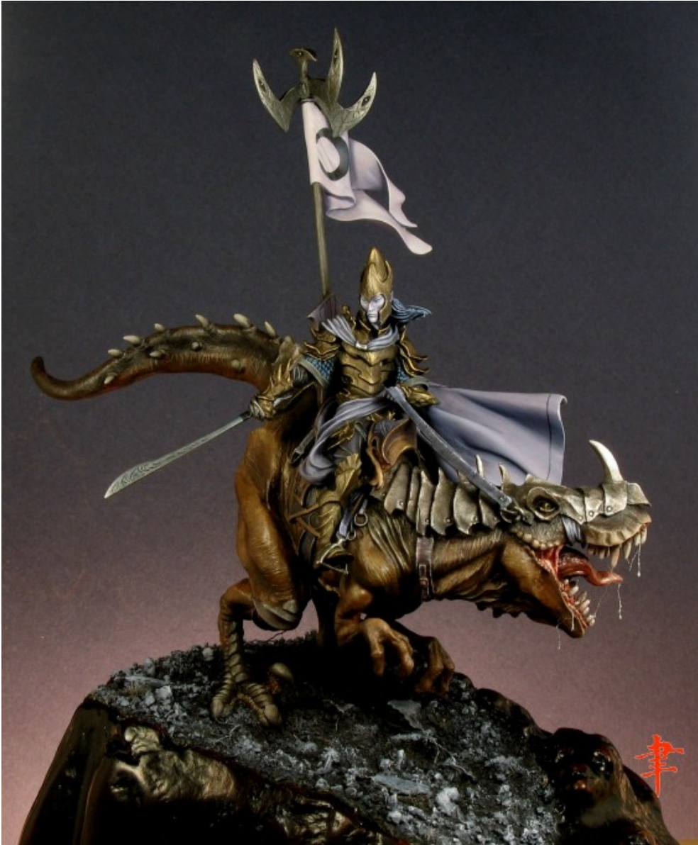
« Varathar » – Du violet, il y en a !

C'est une couleur produite par Lefranc et Bourgeois, mais malheureusement disparue du catalogue depuis quelques années. Difficile à reproduire ! On me pose assez souvent la question : rouge grenat et violet d'Egypte ? Pas loin, mais pas tout à fait quand même. J'ai de la chance, j'en ai un gros tube ; pourvu qu'il ne durcisse pas trop vite !