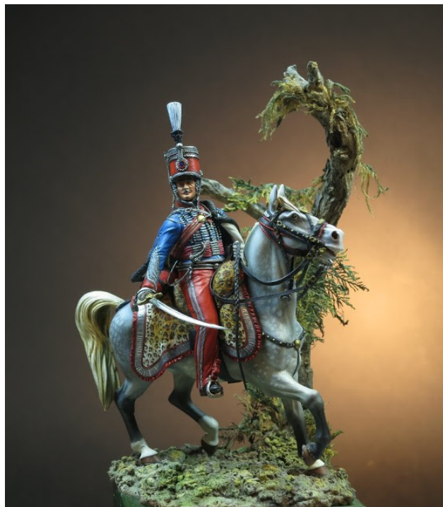
« Maréchal Junot » Peinture de Laurent Potet