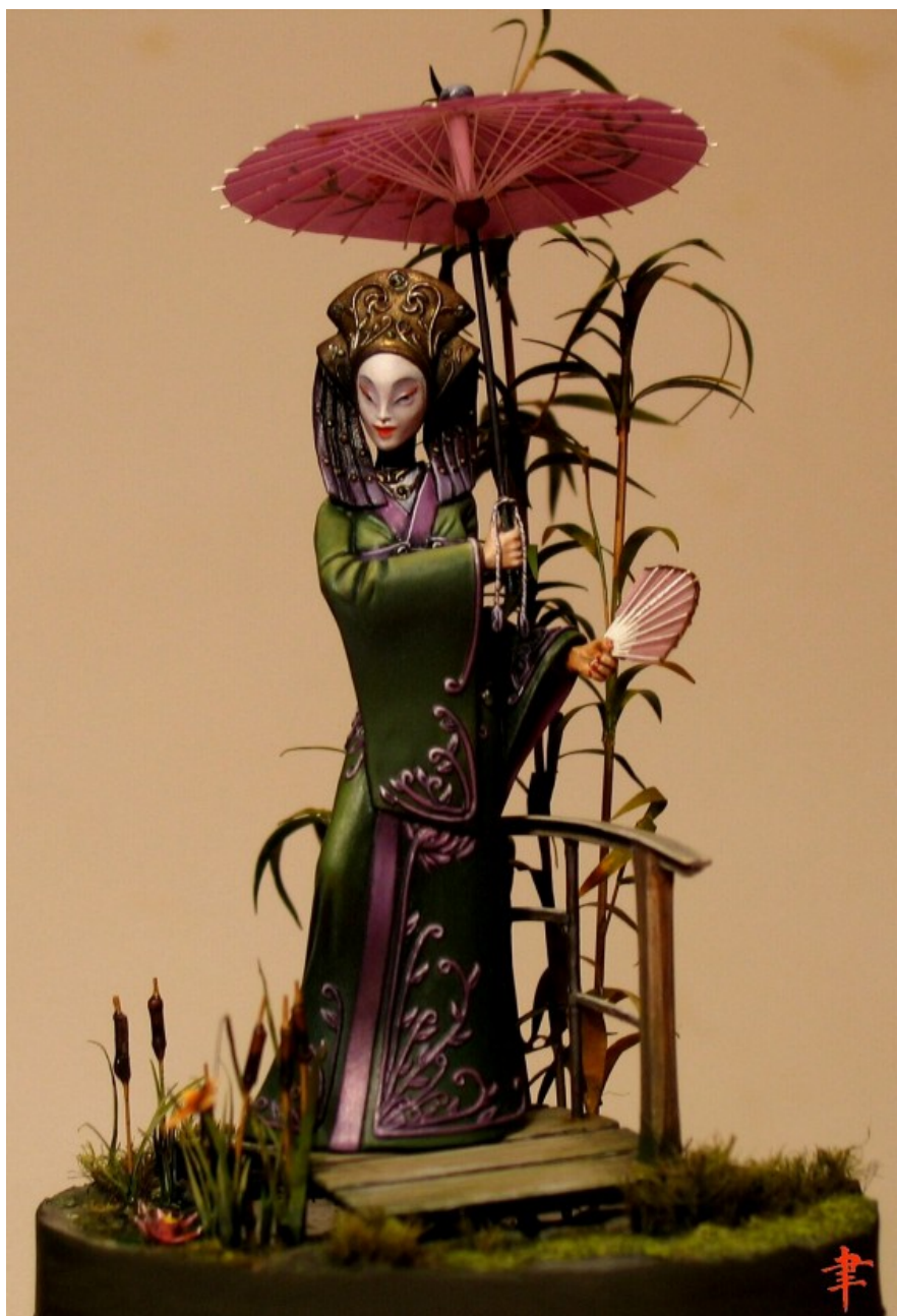
« Zen no ito toki » (un instant de sérénité)

Pas vraiment. Je suis bien dans ma peau de peintre. Heureusement, car je ne me sens pas un grand talent de « sculpteur ». Avant que j'arrive à réaliser une pièce qui vaille la peine d'être peinte ... Alors la sculpture intégrale, non ; mais la transformation, oui, parfois.