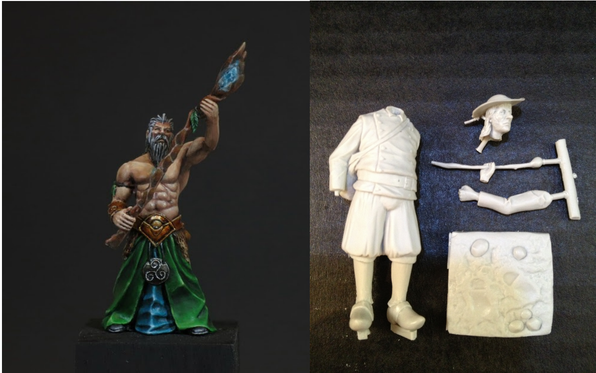
Druide (30 mm) Sculpture : Olivier Bouchet