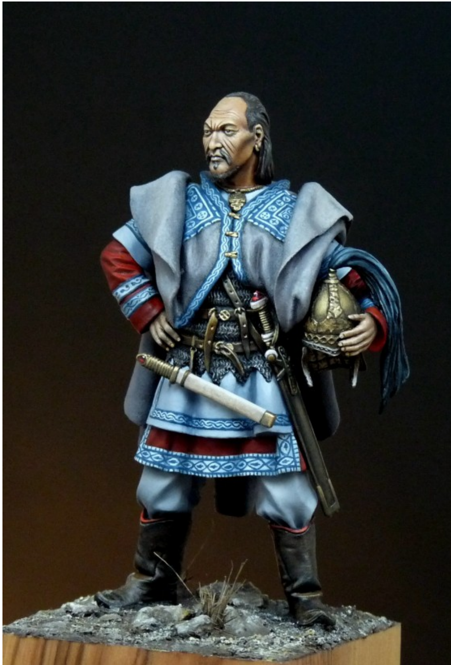
« Cavalier Hun » – Gravure de A Laruccia

Et globalement, quels sont les artistes du monde de la figurine dont tu admires le plus les travaux?