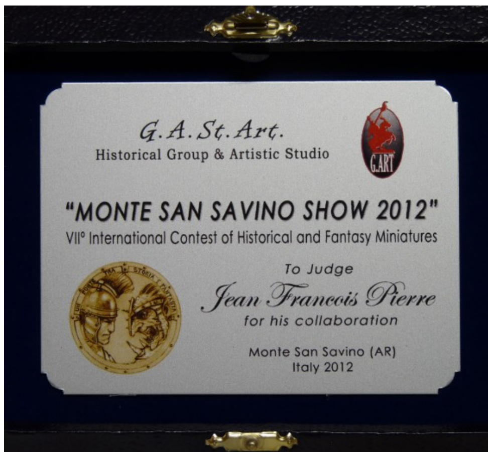
Souvenir du concours de Monte San Savino 2012

Si le niveau actuel de la figurine est ce qu'il est, je crois qu'il est inutile d'en chercher les raisons ailleurs que dans les concours ... et j'en suis donc un fervent partisan !