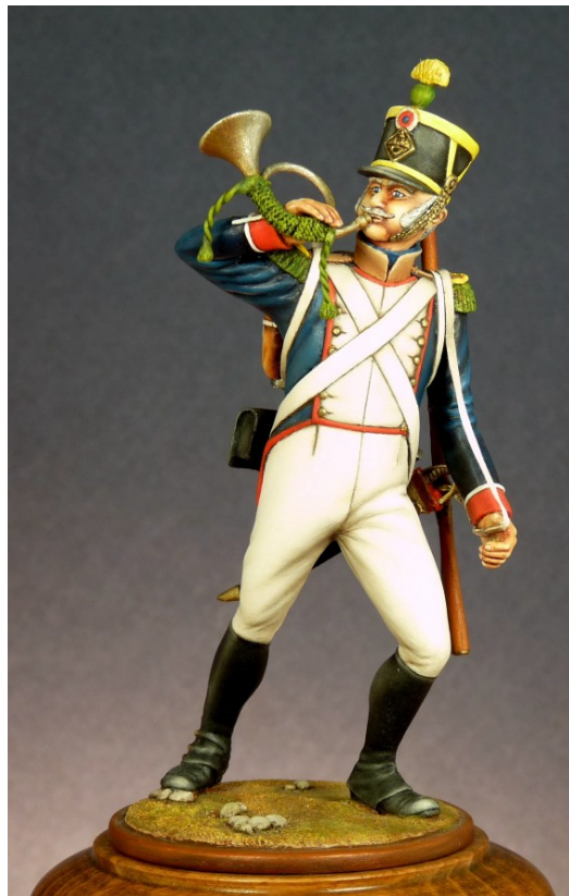
Ma première « vraie » figurine

La première : un cornet de voltigeur de l'armée napoléonienne, pas très original ! Une pièce achetée à Paris au Hussard du Marais, ça ne date pas d'hier. La peinture ne vaut pas grand-chose (un certificat de mérite à Sèvres en 1990), mais c'est la première !