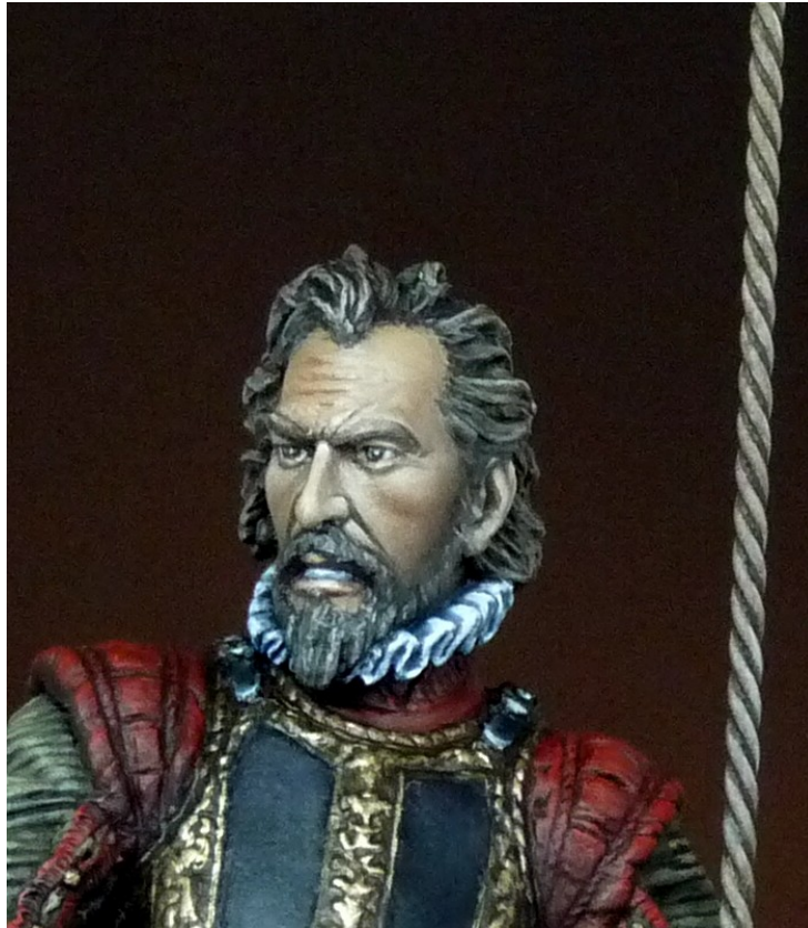
« Sir Francis Drake »