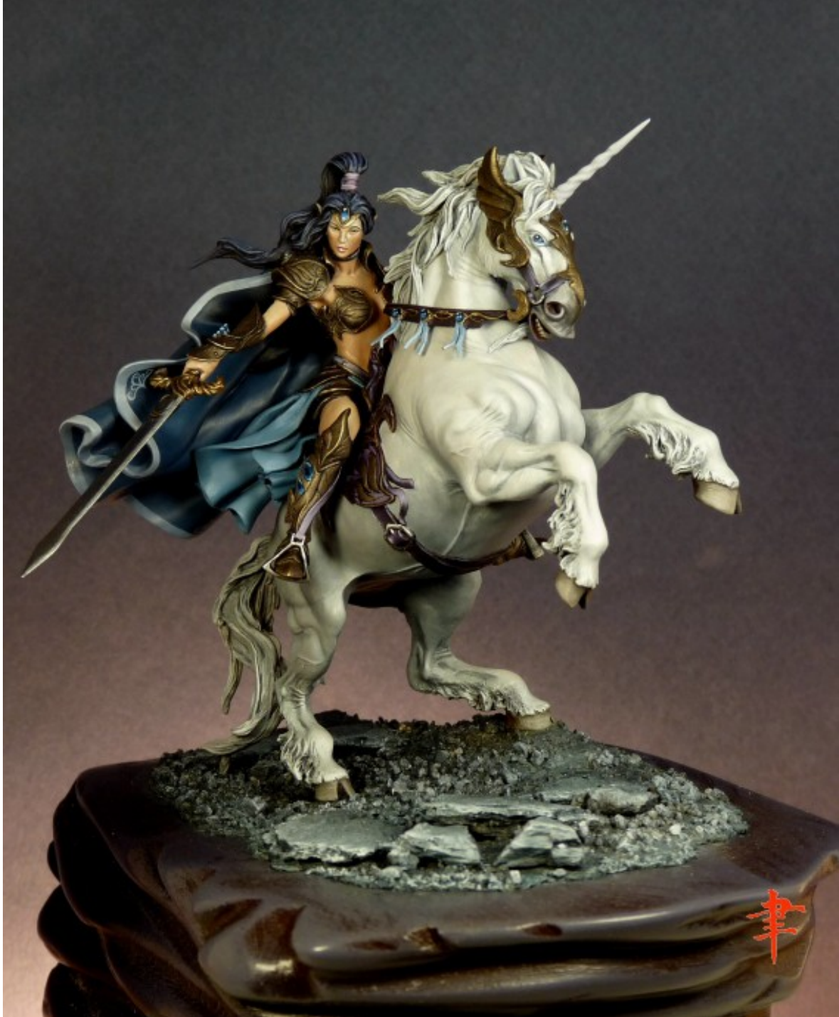
Brume du matin

Et dans le fantastique, il y a des choses très bien aussi, en particulier dans le fantastique médiéval (l'Héroïc-Fantasy). J'adore, même si j'en peins trop peu !